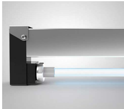
UV-Desinfektionseinheit AR-300-1500 mit Montagehalterung