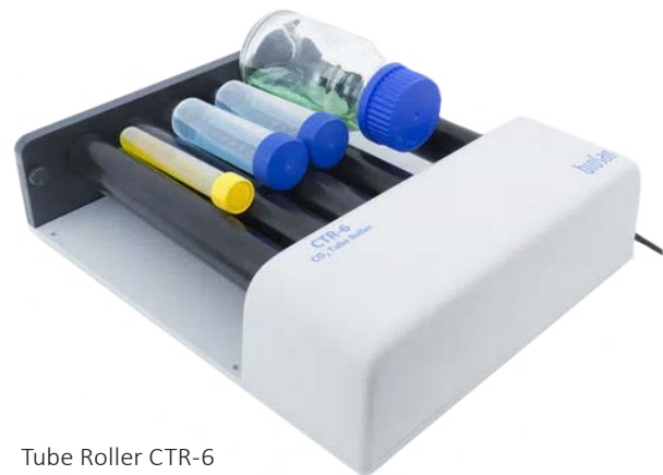
Tube Roller CTR-6