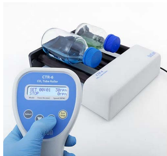
Tube Roller CTR-6 mit Fernbedienung