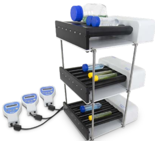
Tube Roller CTR-6 mit Stapelset für drei Tube-Roller