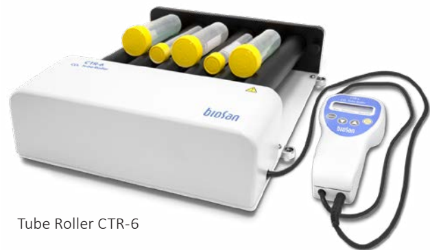
Tube Roller CTR-6