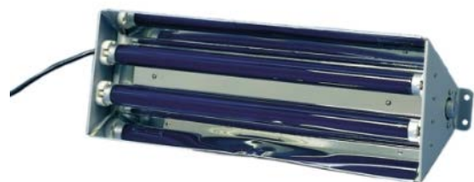
Lampe XX-15BLB, Schwarzlicht