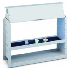
Lampen Ständer für Model XX-15