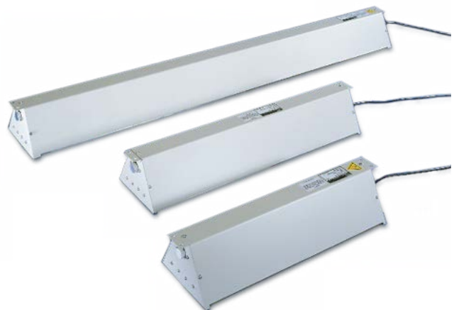
Lampen Serie XX