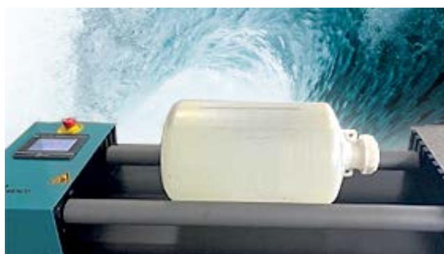
RollerBottle 50 Strong 550 mm