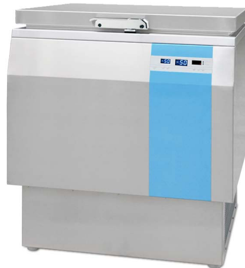
Tiefkühltruhe TT 50-90